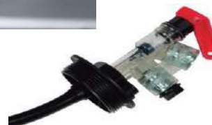
KIT SUCCIÓN-RETORNO GENERACIÓN.