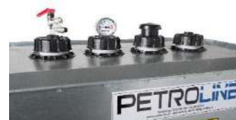
KIT SUCCIÓN-RETORNO GENERACIÓN.