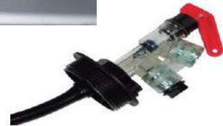
KIT SUCCIÓN-RETORNO GENERACIÓN.